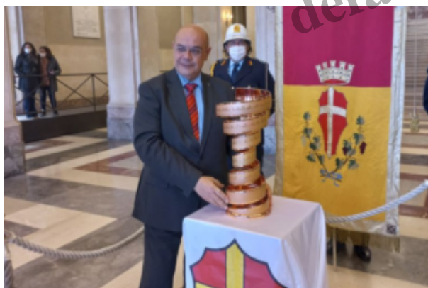
Il Commissario straordinario del Comune Leonardo Santoro con il Trofeo Senza Fine

Fino a lunedì 18 aprile sarà esposto nell'atrio di Palazzo Zanca il Trofeo "Senza Fine" consegnato al Commissario Straordinario del Comune di Messina Leonardo Santoro , nel corso di una breve cerimonia, dai componenti del Comitato Tappa del Giro d'Italia 2022 Francesco Giorgio e Lillo La Rosa. Sarà possibile visitare il Trofeo "Senza Fine" anche domenica 17 e lunedì 18, dalle ore 8 alle 20. Il Trofeo premia il vincitore finale del Giro d'Italia e lo identifica, consegnando il suo nome alla storia sportiva del ciclismo.