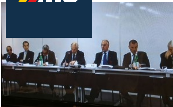
Il collegio del Tribunale Federale Nazionale presieduto da Fabio Artico

Al momento la prospettiva migliore per i biancoverdi, dopo l' esclusione dall'ultimo torneo prospettata da Palazzi, Ã quella di ripartire dall' Eccellenza con una penalizzazione di 10 punti . â œDopo la proposizione dell' appello saranno necessari cinque giorni per la fissazione dell' udienza in cui verrÃ discusso â•. In pratica se il primo responso si conoscerÃ giovedì 20, il nuovo dibattimento si terrÃ giÃ il 27 agosto , proprio il giorno in cui la Lega Pro dovrÃ sorteggiare i nuovi calendari , nei quali compariranno alcuni nomi "sub judge" o delle "ics".