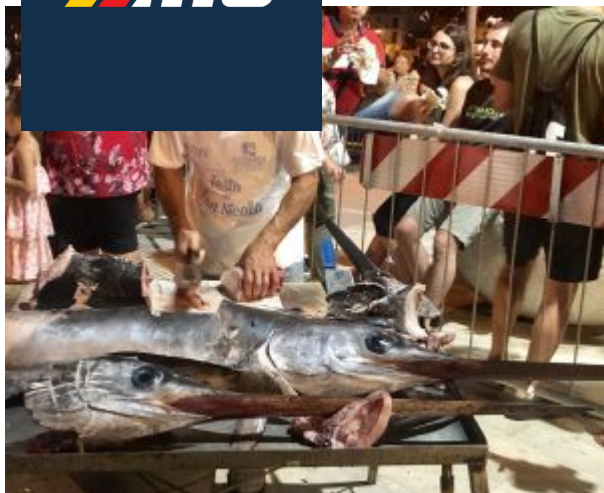
Un momento della preparazione del Pesce Spada arrosto