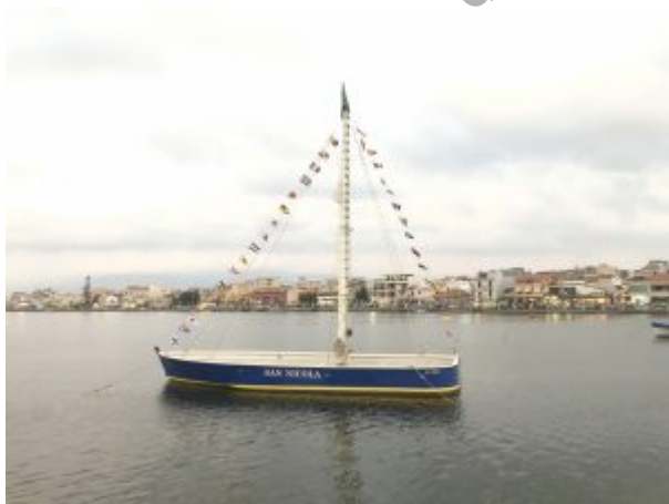
La barca di San Nicola a Ganzirri, sul Lago Grande

Strepitoso il successo della seconda edizione della Notte Bianca di San Nicola, che si Ã svolta a Ganzirri. Il borgo marinaro Ã stato letteralmente preso d'assalto da tantissimi messinesi e turisti che, in un'atmosfera di grande spensieratezza, hanno preso parte alla festa organizzata dalla Parrocchia di San Nicola. Il successo, oltre che dai numeri, emerge dalla perfetta riuscita della manifestazione, che ha messo in moto una macchina organizzativa senza precedenti, premiando gli sforzi dell'organizzazione, che ha visto il coinvolgimento di circa 40 associazioni del territorio e numerosi attori sociali.