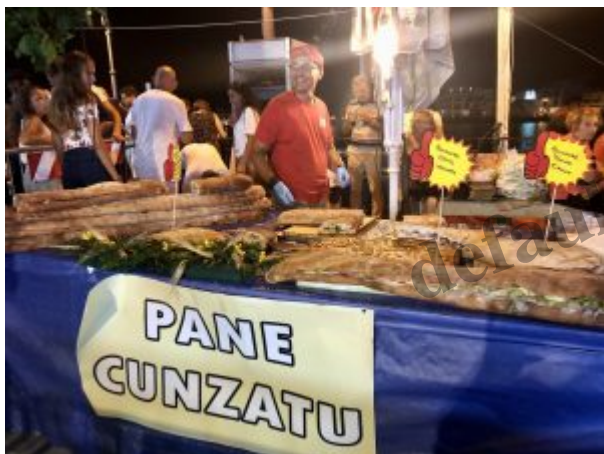
Il "Pane cunzato" durante la Notte Bianca di San Nicola