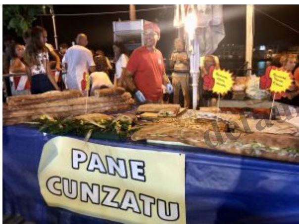
Il "Pane cunzato" durante la Notte Bianca di San Nicola