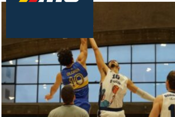
La palla a due di Ragusa-Torrenova