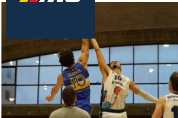
La palla a due di Ragusa-Torrenova