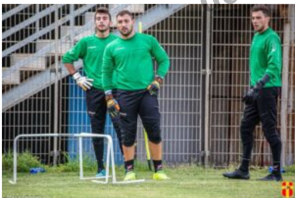
Cinque i portieri presenti al Celeste per il ritiro

L'organico parlerà ancora una volta tante lingue: “Fino alla scorsa estate c'era molto scetticismo attorno a noi: qualcosa di buono lo abbiamo fatto, acquisendo credibilità e portando a Messina tanti stranieri . Sappiamo di non aver vinto nulla ma questa è la strada giusta da intraprendere: possiamo fare qualcosa d'importante” .