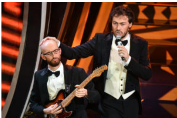
I Pinguini Tattici Nucleari sono la rivelazione del Festival

Il festival ha unito ancora una volta l’Italia, mantenendosi sempre sopra il 50% di share , risultati che non si registravano da vent’anni. Grazie al televoto, che pesava per un terzo del totale, è risalito fino al 14esimo posto conclusivo il messinese Alberto Urso , relegato in precedenza nei bassifondi della graduatoria principalmente dalle preferenze espresse dalla sala stampa. La sua “Il sole ad est” ne ha ancora una volta esaltato le capacità vocali, pur senza dare l’impressione di sfondare davvero, a differenza di pezzi subito orecchiabili. Per il 22enne vincitore di “Amici” è comunque un battesimo importante nella kermesse più amata dal pubblico italiano.