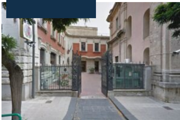
Gli esterni della Questura di Messina

Una volta riconosciuti per i responsabili Ã" immediatamente scattata la segnalazione alla locale AutoritÃ Giudiziaria nonchÃ© lâ€™avvio delle procedure per lâ€™irrogazione del provvedimento Daspo.Ã Gli ultras non potranno accedere ai luoghi in cui si svolgono manifestazioni sportive. Dieci di loro per un periodo compreso fra i tre e i cinque anni , gli altri tre per un periodo di sei anni . Questâ€™ultimi, considerati i precedenti specifici e la spiccata pericolositÃ sociale, dovranno altresÃ- rispettare ulteriori prescrizioni, ossia presentarsi, in occasione di tutti gli incontri di calcio disputati dal PaternÃ² Calcio, presso gli uffici di polizia competenti per territorio.