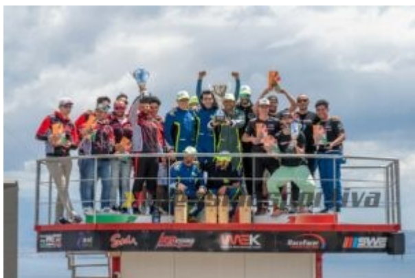
Podio F2