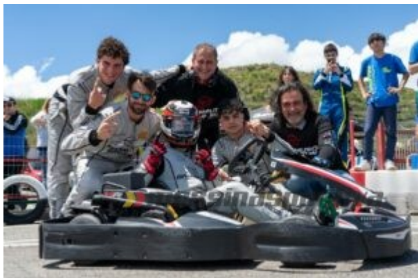
Il team Dammuso Dad Son

Lo scenario, fino ad aumentare sensibilmente, complicando i piani dei team e rendendo più arduo il compito per l'asfalto viscido. Il meteo migliora dalle prime luci dell'alba, in proiezione di una gara da correre sotto il sole. Quando mancano due ore Dammuso Dad&Son tiene il vantaggio su Gattopardo (a 11 giri di distanza ma con due pits in più) e Kairos Racing. Situazione pressoché invariata ad un'ora dal "gong". Dammuso Dad&Son effettua la ventinovesima sosta proprio a ridosso della chiusura e conserva tre giri di margine sul principale inseguitore, un gap rassicurante.