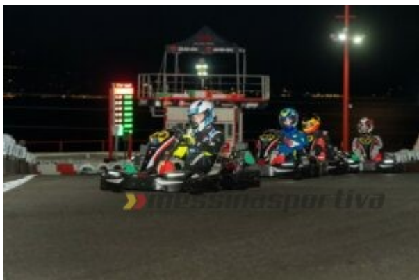
Fase gara notturna

La sfida entra nel vivo, con la durata massima di ogni stint pari a 65' e l'alternanza dei piloti alla guida. Allo scoccare delle due ore Gattopardo conduce su Dammuso Dad&Son, Eiriz Pro e Kairos Racing, lotta a quattro che infiamma subito il pubblico. Si diversificano, quindi, le strategie, con i team manager instancabilmente al lavoro per monitorare i tempi e scegliere le migliori soluzioni possibili. Trascorse 6 ore, Kairos Racing ha osservato 5 pits, Dammuso Dad&Son e Gattopardo 6, Eiriz Pro 7.