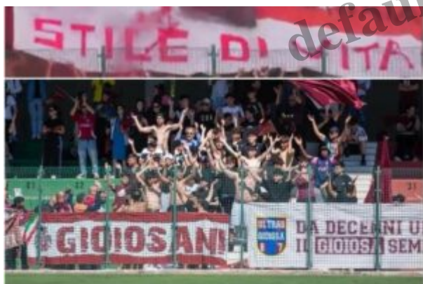
I sostenitori del Gioiosa

Delusione ma anche tanto orgoglio. Sono i sentimenti predominanti nella Polisportiva Gioiosa dopo la dolorosa sconfitta nella finalissima play-off contro l' Avola , che si è disputata al “Valentino Mazzola” di San Cataldo, decisa da una rete di Alfò dopo appena un quarto d’ora. Un vero e proprio appuntamento con la storia mancato per la formazione granata, arrivata alla sfida al termine di una stagione comunque positiva, ben oltre le più rosee aspettative.