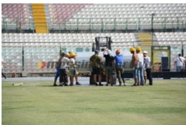
Lavori in corso al “San Filippo”

Quale l’indotto per la citt  di Messina grazie ai due concerti? “Viene solitamente calcolato che in citt  come Milano e Torino   pari a sette volte l’incasso da botteghino. Qui, essendo meno ricchi, arriver  ad essere quattro o cinque volte l’incasso. Una ricaduta enorme per la citt . Basti pensare che per l’8 non c’  pi  una stanza d’albergo libera nel giro di 40 chilometri”.