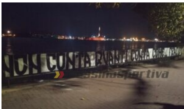
Uno degli striscioni, sullo sfondo la Madonnina