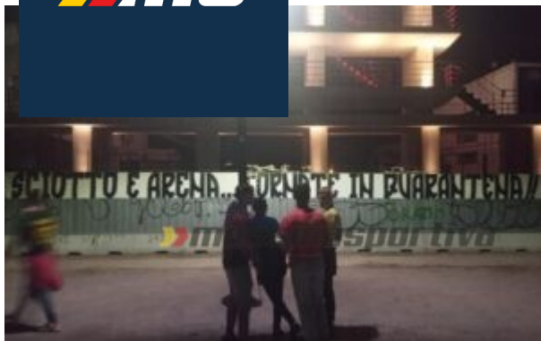
Gli striscioni esposti a ridosso della Fiera