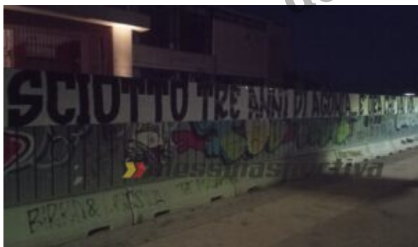
Uno striscione rivolto alla proprietÃ dell'Acr Messina