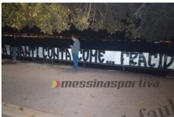
Uno striscione a ridosso dello Stretto