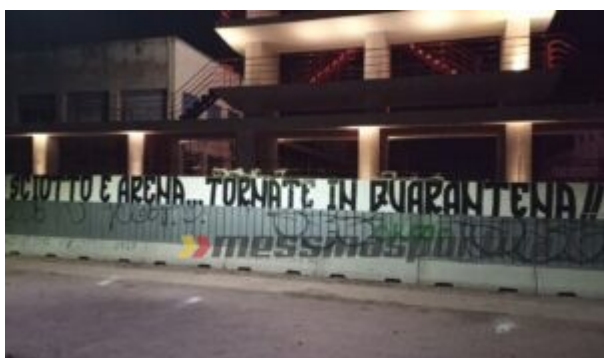
Uno dei tre striscioni esposti alla Passeggiata a mare