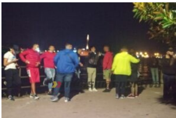
Alcuni sostenitori presenti alla Passeggiata a mare