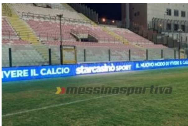
I pannelli a led attivati e poi subito rimossi al "Franco Scoglio"

Agibilità a parte, c'è infine la questione dei led, che il Fc vorrebbe ricollocare anche in virtù dell'accordo di sponsorizzazione con Infront. Ma dall'Ac non è arrivata alcuna risposta in merito.