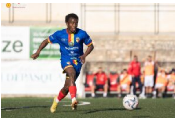
Bald  della Jonica in azione (foto Giuseppe Zangh )

Coledi illustra il proprio ruolo all'interno della Jonica: “Fino alla passata stagione mi sono occupato del settore giovanile, con cui mi sono tolto parecchie soddisfazioni. All'inizio della stagione la societ  mi ha affidato l'aspetto puramente organizzativo: era fondamentale dotarsi di un team manager mancato in passato. Trascorro molto tempo insieme allo staff tecnico e alla squadra, curo i rapporti con le altre societ  e mi occupo sia dell'organizzazione delle trasferte che dell'accoglienza delle squadre ospiti a Santa Teresa di Riva. Cerco di essere sempre al fianco dei ragazzi. Avendo molti giocatori che provengono da altre parti del mondo spetta a me occuparmi di alcune problematiche extracalcistiche: cerchiamo di farli sentire in famiglia” .