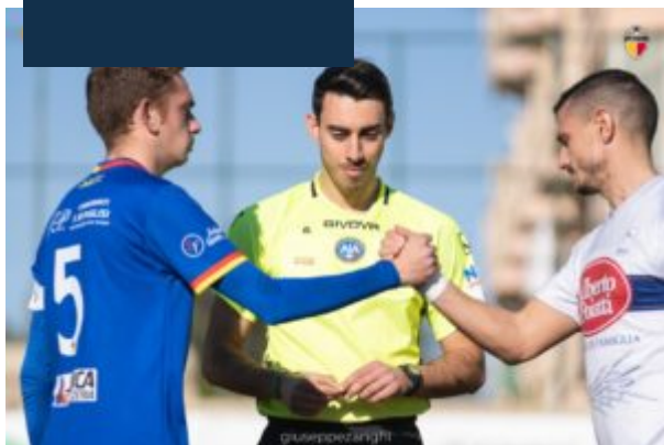
Savoca e Cassaro, capitani di Jonica e Nebros (foto Giuseppe Zangh )

Coledi illustra il proprio ruolo all'interno della Jonica: “Fino alla passata stagione mi sono occupato del settore giovanile, con cui mi sono tolto parecchie soddisfazioni. All'inizio della stagione la societ  mi ha affidato l'aspetto puramente organizzativo: era fondamentale dotarsi di un team manager mancato in passato. Trascorro molto tempo insieme allo staff tecnico e alla squadra, curo i rapporti con le altre societ  e mi occupo sia dell'organizzazione delle trasferte che dell'accoglienza delle squadre ospiti a Santa Teresa di Riva. Cerco di essere sempre al fianco dei ragazzi. Avendo molti giocatori che provengono da altre parti del mondo spetta a me occuparmi di alcune problematiche extracalcistiche: cerchiamo di farli sentire in famiglia” .