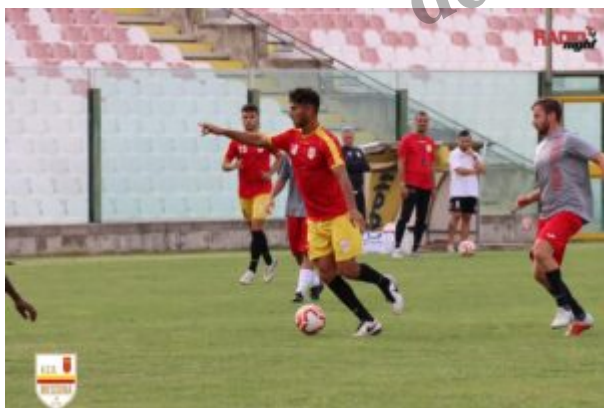
Il Riviera Nord impegnato in amichevole con l'Acr Messina

Ci rivolgiamo e appelliamo all'assessore Francesco Gallo e all'Amministrazione Comunale, perch   il problema coinvolge tutto l'universo dilettantistico cittadino a partire dalle nostre societ   che in questo momento rappresentano la massima espressione dello stesso dalla Serie D in gi  . Ad oggi, nonostante sollecitazioni e richieste, abbiamo ricevuto solo silenzi, risposte negative o non convincenti da soggetti competenti o gestori per usufruire delle strutture di gestione comunale, diretta o concessa in uso. Un paradosso che per alcune delle nostre societ  , che non dispongono di propri spazi, riguarda anche gli allenamenti settimanali per prime squadre e settori giovanili.