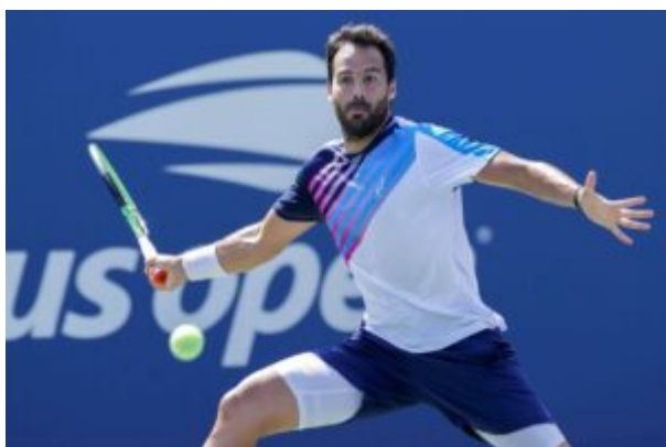
Salvatore Caruso vantava le qualificazioni al Roland Garros e all'Us Open

29 anni compiuti a dicembre, Caruso Ã nato ad Avola, in provincia di Siracusa. Il suo debutto nell'ATP Tour Ã datato 2016 agli internazionali di Roma (con una wild card). Nel 2019 ha conquistato il terzo turno al Roland Garros (da qualificato, battuto da Djokovic), l'anno successivo ha superato due turni anche all' Us Open .