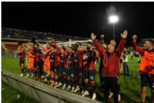
Il Taranto raccoglie l'applauso dei 7mila dello Iacovone

L'undici iniziale del Messina scelto da Modica lo ha stupito, ma ha saputo immediatamente trovare le giuste contromisure. “Mi aspettavo il 4-3-3 , lui non ha mai giocato 3-5-2 . Quando ho visto la formazione per dare le ultime indicazioni mi sono accorto del modulo, conoscendo dopo tanti anni tutti i giocatori. Abbiamo cambiato tutte le uscite e siccome ho una squadra molto diligente che segue l'allenatore abbiamo impattato in modo devastante. Se una squadra crea 8-9 occasioni nel primo tempo un allenatore puÃ² essere soddisfatto, sicuramente potevamo far meglio in zona gol”.