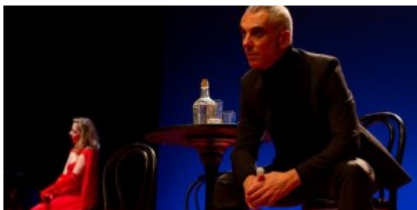
Le Olimpiadi del '36 in scena

Il film "Olympia" è diventato una leggenda del cinema nella regia di Leni Riefenstahl. I nazisti volevano trasformare le Olimpiadi nell'apoteosi della razza ariana, invece i simboli dell'uguaglianza.