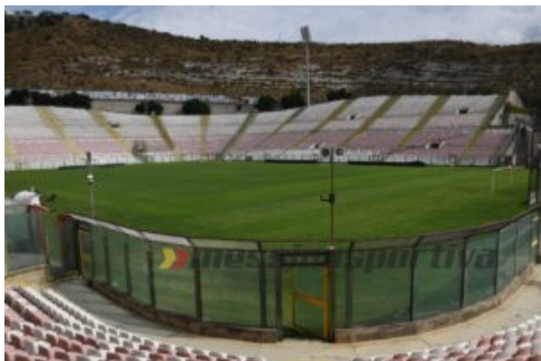
Il campo visto da una porzione della Curva Sud

to strascichi legali. “Lo stadio Ã un capitolo importante, forse Ã l’unico con delle ari nel Sud Italia , ci stiamo lavorando e ragionando. Anche da questo punto di porterÃ delle novitÃ . Non Ã detto che torneremo sulla strada dell’ affidamento no provato ed Ã andata com’Ã andata, ma ci stiamo facendo delle idee e credo che stiamo dimostrando di sapere gestire il patrimonio del Comune”. Ã