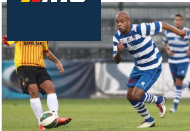
La punta francese in azione con la maglia della Pro Patria

Come vi avevamo già rivelato, sulle sue tracce vi sono Lecce e Casertana , due squadre in cui ha già militato, ed almeno altri due club: «Ho ricevuto anche le proposte di Francavilla e Paganese . Per cui ho ampia possibilità di scelta» . Agrodolce l'ultima esperienza di Martina: «È stata la migliore annata da quando gioco. Stavo bene e non avevo mai segnato così tanto. La squadra giocava per me e io ho sfruttato ogni palla giocabile. Ho realizzato 14 gol , considerando anche quello dei play-out . Abbiamo avuto tanti problemi societari, tante vicissitudini, ma alla fine ci siamo salvati. È un vero peccato che adesso la squadra non si sia più iscritta. Ci sono rimasto davvero male» .