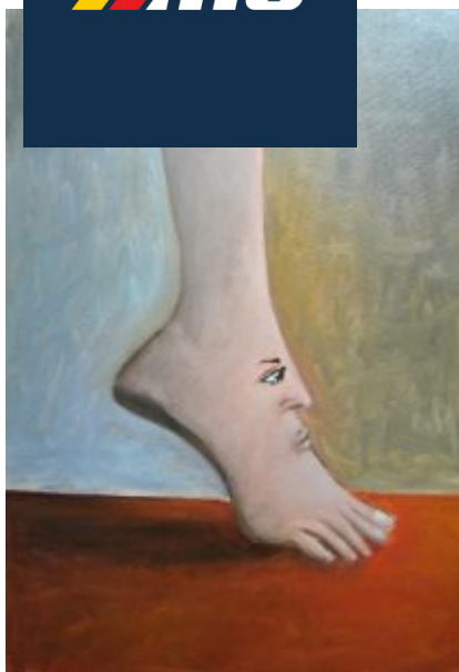
Uno dei quadri di Mantilla

L'ARTE – Impulsivo e primitivo quasi per esigenza fisiologica, Mantilla ha, in realtà, uno stile peculiare assai riconoscibile. La sua pittura è nettamente figurativa, vicina per certi versi a quella di Carrà o a Novecento, tuttavia le figure sono nella plasticità e nelle forme volutamente anticlassiche. Esalta le asimmetrie degli arti e degli sguardi, le pieghe della carne, il livore della pelle, senza compiacimento, ma con un sottile e profondo senso d'indagine. I suoi nudi invitano al dialogo, sembrano voler spiegare allo spettatore il senso dello smarrimento degli ambienti vuoti. La potenza di questo carismatico racconto è ancora più forte nei ritratti. Nella grafica, Mantilla dimostra un'articolata concezione spaziale, plastica e cromatica, che sa usare cornici, chiaroscuri e fondali per creare immagini vivide, cariche di dinamismo e di una drammatica e costante forza psichica.