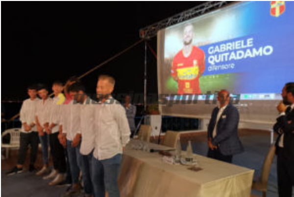
La presentazione del Fc Messina nell'agosto 2019

L'immagine. Siamo il Fc Messina e ci vogliono ordine e serietà. È una stupidaggine ma ai miei dirigenti imporrò di presentarsi al campo sempre in ordine e curati. La nostra sede in centro è piccola ma dietro lo studio: è vissuta.