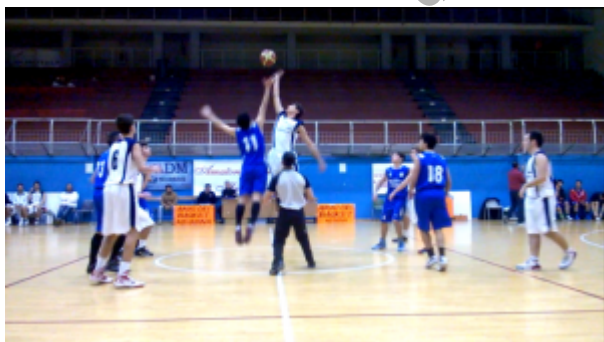
La palla a due del match

La Mia Basket Messina non riesce a conquistare il successo nell'anticipo disputato al PalaTracuzzi contro la Vigor Santa Croce , una squadra che basa le proprie fortune sulla buona circolazione di palla, l'affiatamento e la presenza nel roster di qualche buona individualità. La formazione messinese esce sconfitta di misura dal confronto con gli iblei dopo una gara dai due volti. Ad un primo tempo privo di mordente, durante il quale il team di Massimo Sigillo non ha praticamente difeso, lasciando troppo spesso l'iniziativa agli avversari, si è alternato un secondo tempo giocato con la giusta grinta, tirata fuori purtroppo tardivamente.