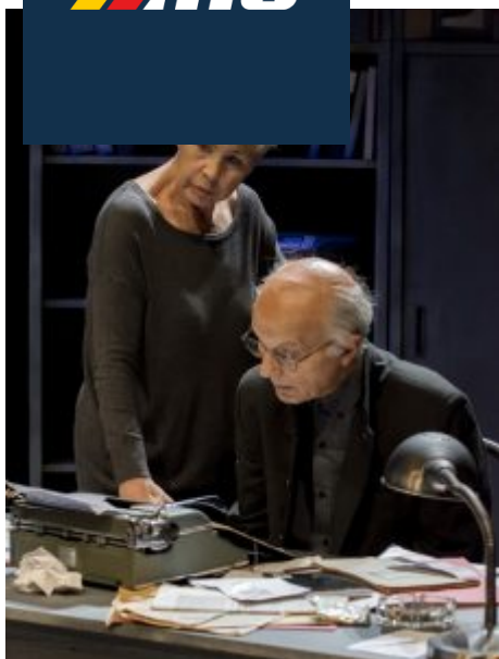
Gli attori in scena

Le menzogne si sbriciolano pezzo dopo pezzo, come "accaduto al muro", eppure le rivelazioni contenute in dossier segreti e nelle annotazioni inquisitorie non bastano a lasciar emergere la verità: l' "enigma pi" incisivo riguarda una sorta d' "inversione di ruolo tra persecutore e perseguitato. Le trame del passato confermano la certezza che la storia " incisa nella carne degli esseri umani, " segnata dalla sofferenza e dalla omologazione entro lo schema di una assurda normalità .