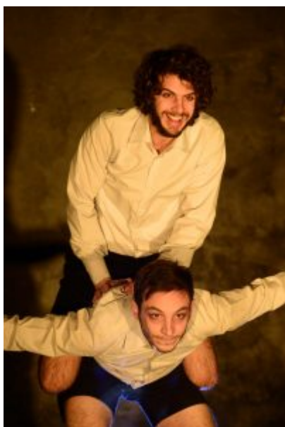
Gli attori in scena

In questo mondo nuovo (o forse alla fine di uno vecchio) troviamo due fratelli, rinchiusi, soli con il pensiero costante del fuori, di ciò che è stato, di ciò che sarà. Due bambini persi nel loro gioco che simula il mondo, due orfani che reinventano la propria sconosciuta storia familiare, due superstiti che indagano sulle cause della fine, forse due esemplari di una nuova specie, all'ombra di una natura tutta da immaginare. Il loro rapporto è fatto di lotta, soccorso, sfida, gioco, prevaricazione e un amore che non ha più le dimensioni del lecito e del comune.