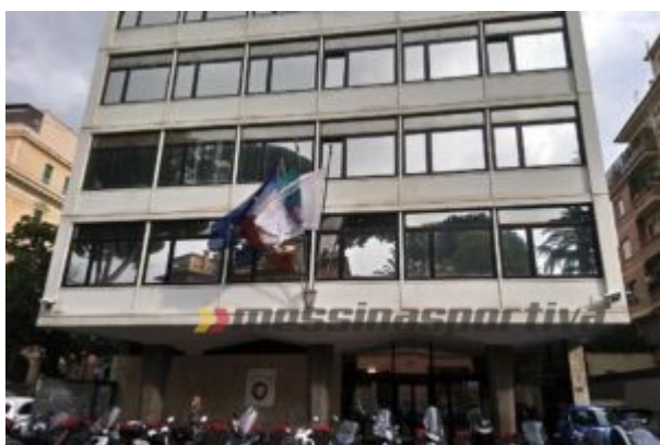
La sede della Federcalcio di via Allegri

Ci aspettavamo un incentivo istituzionale alla ricerca di accordi sulle mensilità coinvolte dall'emergenza sanitaria e ci ritroviamo un avallo al contenzioso che sarà, nella maggior parte dei casi, strumentale e pregiudicherà soprattutto le categorie più deboli. Alla luce di quanto sopra, la nostra Associazione auspica l'adozione di un sistema che favorisca le intese collettive volte a risolvere le problematiche anziché fomentare un contenzioso generalizzato .