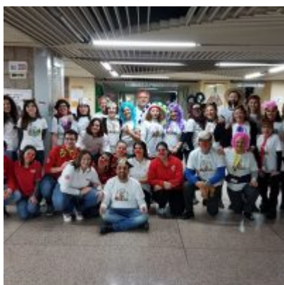
Il gruppo di volontari