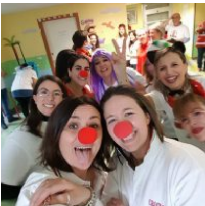
Un selfie dei volontari