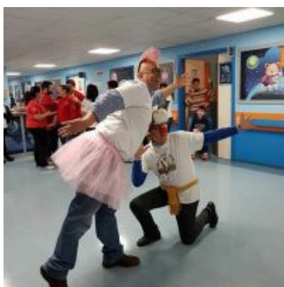
I volontari divertono i bambini

Lo scorso 10 febbraio presso il Padiglione Pediatrico NI del Policlinico di Messina l'Associazione Amici del Bimbi in Corsia ha invitato i volontari della Croce Rossa Comitato di Messina allo scopo di realizzare un pomeriggio di festa per il Carnevale. I bimbi, attualmente ricoverati presso l'ospedale, grazie ai volontari, truccati e travestiti per l'occasione, hanno potuto così divertirsi all'insegna di balli, magia, colori, risate e soprattutto tanto divertimento. ABC, che ogni giorno è presente all'interno dei reparti pediatrici, ha potuto così far vivere una giornata di allegria e soprattutto normalità ai piccoli pazienti dell'ospedale.