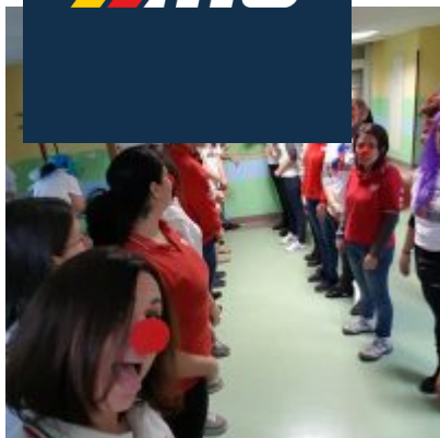
Un momento della giornata di Carnevale al Policlinico