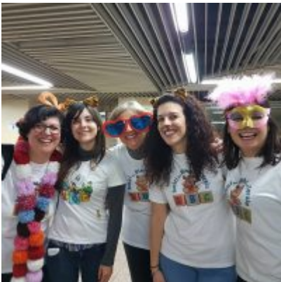
I volontari dell'associazione Amici dei Bimbi in Corsia