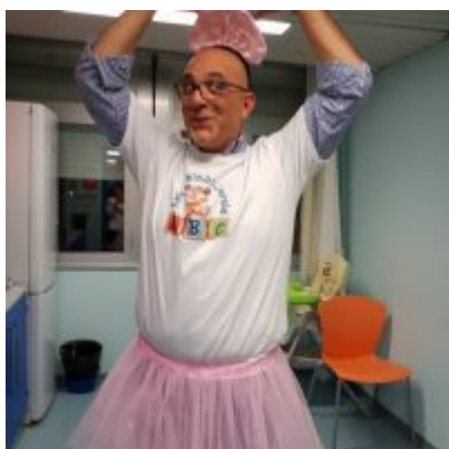
Un volontario durante la giornata di Carnevale per i bimbi del Policlinico