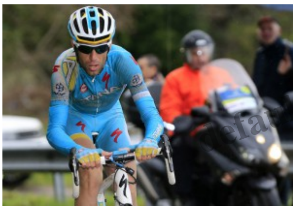
Vincenzo Nibali in azione

Lo "Squalo" si " concesso un periodo di relax prima di partire per il ritiro spagnolo di Tenerife. Dall'8 al 15 giugno parteciper" alla corsa a tappe francese. Il 5 luglio scatta invece il Tour, grande obiettivo stagionale del corridore dell'Astana.