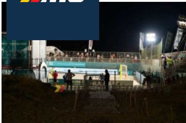
Il Beach Stadium di Torre Faro

Pienamente raggiunti gli obiettivi della manifestazione che, attraverso il veicolo dello sport e del suo straordinario movimento aggregante, hanno messo in primo piano non solo le peculiarità di un luogo unico come lo Stretto di Messina, ma tutto quanto ad esso è stato collegato all'interno della grande area del Beach Soccer Village, ovvero: la promozione dei prodotti tipici locali con lo street food, i laboratori del gusto, gli show cooking, le escursioni a bordo delle feluche; la valorizzazione dei talenti e dei giovani con gli spettacoli, i concerti dal vivo, i festival musicali, ed ancora il "sociale" con tante realtà di valore della città di Messina che hanno avuto modo di incontrarsi, conoscersi, fare rete e prossimamente fare anche progetti insieme.