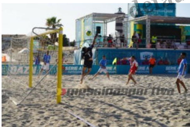
Il Città di Milano in gol

Pienamente raggiunti gli obiettivi della manifestazione che, attraverso il veicolo dello sport e del suo straordinario movimento aggregante, hanno messo in primo piano non solo le peculiarità di un luogo unico come lo Stretto di Messina, ma tutto quanto ad esso è stato collegato all'interno della grande area del Beach Soccer Village, ovvero: la promozione dei prodotti tipici locali con lo street food, i laboratori del gusto, gli show cooking, le escursioni a bordo delle feluche; la valorizzazione dei talenti e dei giovani con gli spettacoli, i concerti dal vivo, i festival musicali, ed ancora il "sociale" con tante realtà di valore della città di Messina che hanno avuto modo di incontrarsi, conoscersi, fare rete e prossimamente fare anche progetti insieme.